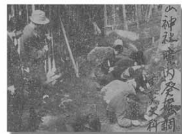
浦谷町が誇る産金の遺跡は、昭和32年に発掘調査、同34年に県指定重要文化財に指定された。