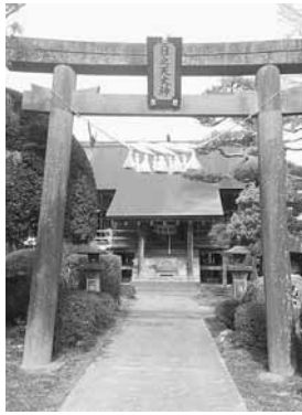
旧涌谷神社本殿 （現存。）

さて、神霊奉遷後の旧神殿ですが、拝殿（間口六間・奥行三間・神明造）は、大正昭和の涌谷警察署内の「武徳殿」となり、さらに涌谷町役場の敷地内に移されて、平成八年三月まで、庁舎として使用されました。