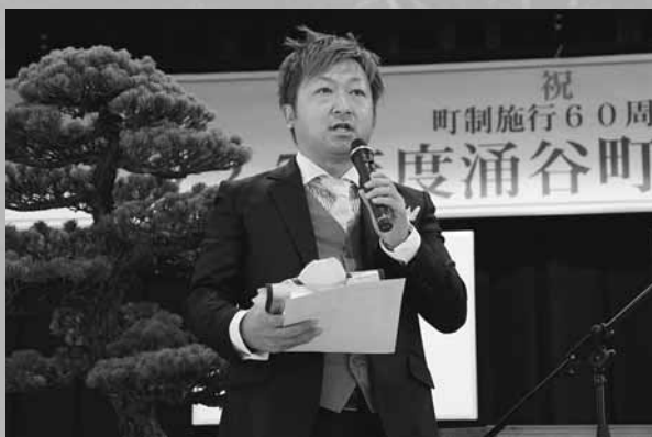
【写真】大使に任命された大和優雅監督

町制施行60周年を記念し、涌谷町の日本初の産金の歴史を全国にPRする「涌谷町黄金大使」を創設し、涌谷町出身の映画監督・大和優雅氏を任命いたしました。