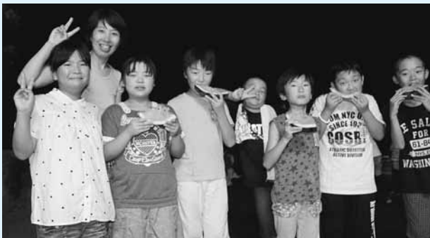
写真)校庭でキャンプファイヤーと花火、スイカを楽しむ皆さん

7月17日(金)に、笹岳小学校において、来年春の小里小学校との統合を前に最後の夏の思い出づくりとして、全学年の児童が参加する小学校校舎でのお泊り会が実施された。 保護者の皆さんにもご協力いただき、笹岳山笹岳寺での座禅体験に始まり、笹岳小学校校舎で夜ご飯をみんなで共にし、校庭でキャンプファイヤーや打ち上げ花火、スイカを食べ、最後に、お楽しみのお試しといった盛りだくさんの内容。児童の皆さんにとって、笹岳小学校での最後の夏にして、最高の夏の思い出となったのではなからうか?