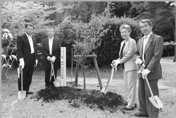
【写真左】写真右から2番目が梁桂和総領事さま