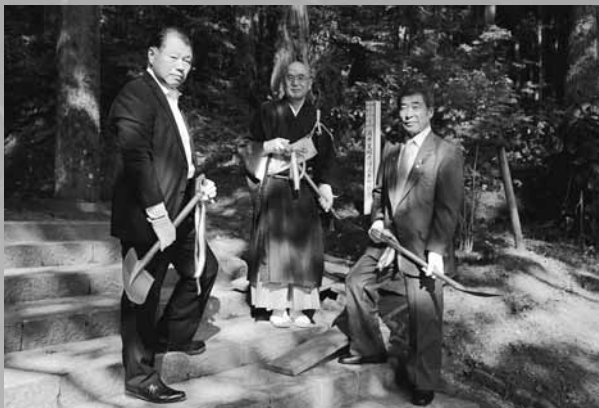
【写真右】写真中央が筒井寛昭別当さま

建町記念式典前日の7月14日(火)に、黄金山神社において、町制施行60周年記念と東大寺別当筒井寛昭さまと駐仙台大韓民国総領事梁桂和さまの来町を記念した植樹を行いました。