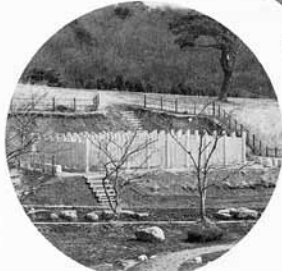
子どもたちの遊び場迷路