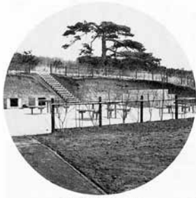
給排水施設・食卓