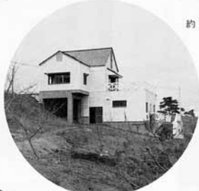
地場産品直売所を兼ねた管理棟（水洗トイレ付）