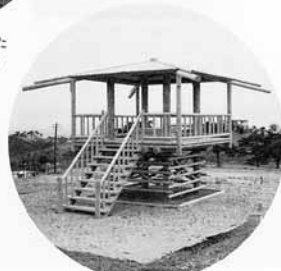
東に石巻、太平洋、西に船形山が望める展望台を兼ねた休憩所

昭和61年度・62年度の二か年にわたって余暇時間が増大する社会情勢と多様化する地域の業際時に対応するため、「石仏広場」を町民の憩いの場とする目的で施設整備されました。 今年実施されたNONDAKE CAMPの際にも利用されていた屋外給排水施設をはじめ、現在は老朽化のため使用できない迷路が作られ、地域の子ども会等の行事で大いに利用されています。 供用が開始された初年度は、一年間で約1万3千人もの人々が利用（平成元年5月号より）。 NONDAKE CAMPにより石仏広場の交流の場としての可能性が改めて見直されたことでしょう。