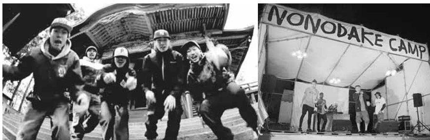
(左) 笠峯寺で撮影され地元への思いが詰まったPV (右) 熱い涌谷への思いがこめられたステージ