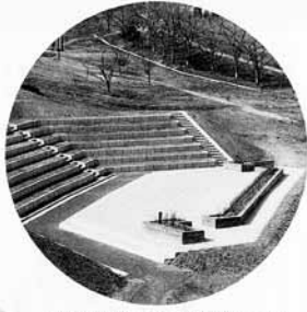
約500人収容できる屋外ステージ