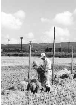
▶ 稲束の棒架け乾燥