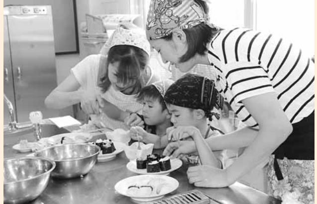
写真) 上: 切り落とされた魚の頭の中を見て絶叫する子もいれば、乗り出して見る子も 下: 親子で軍艦巻きに挑戦。きれいにできたかな?