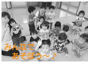
みんなであそぼう〜♪

収穫の秋を迎え、さくらんぼ子ども園の畑で収穫した大きな大きなサツマイモを使って、