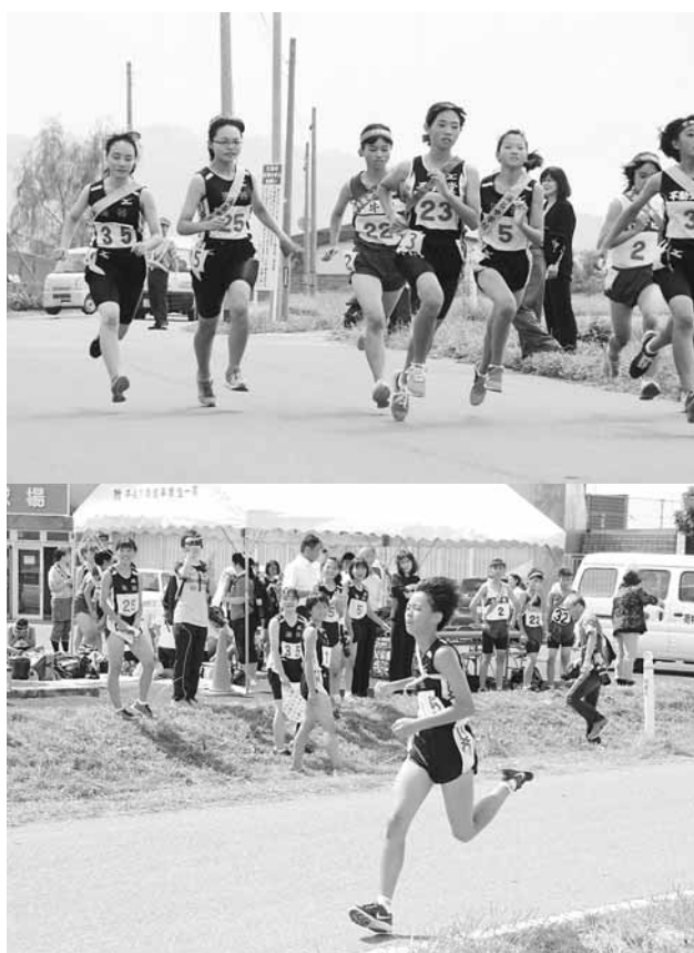
写真) 上: 新生涌谷中学校としての新駅伝ユニフォームを身にまとい、いざスタート 下: 仲間たちの声援を背に受け、懸命に駆け抜けた