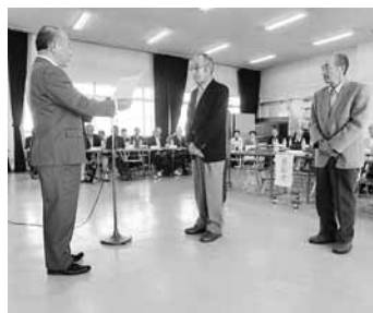
長年の活動に対し感謝状贈呈