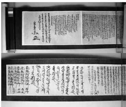
▲篁峯寺本尊胎内経(文和2年・1353年)