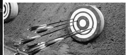
(左)今年度のわかやま国体4位入賞の賞状(中)矢を射る瞬間、研ぎ澄まされた気がこもる(右)練習とはいえ、28m先の的に6本すべての矢が的中