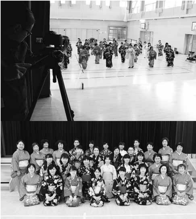
(上)撮影終了まで3回踊っていただきました (下)ご協力いただいた皆さん