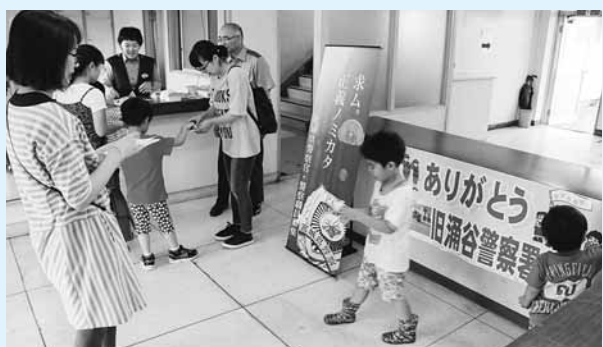
写真) 多くのちびっ子たちが来場しておったぞ

7月9日(土)に、役場隣の旧涌谷警察署で施設見学会が開かれた。これまで涌谷幹部交番として使われていたが、東日本大震災などによる老朽化がひどく、取り壊されることに。 その取り壊しを前に、地域の皆さんにその内部が公開されたんじや。子どもたちにうれしいパトカーの乗車体験のほか、写真には写すことができない留置場などの普通に生活していたら決して足を踏み入れない場所までみることもできた。 今後は、新たな幹部交番が建設され、地域の安全を守ってくれるそうじや。