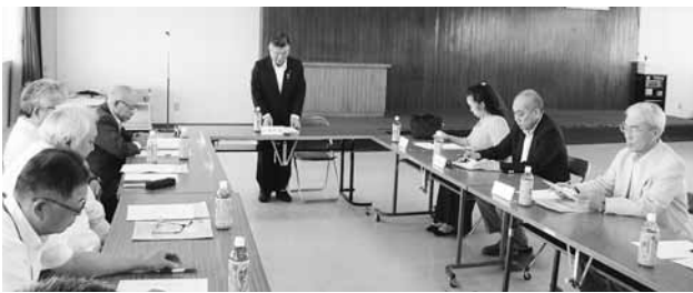
【涌谷町空家等対策協議会委員名簿】

今後、対策計画(素案)については、パブリックコメントを実施したのち、再度協議会を開催し計画策定を目指します。