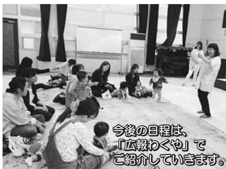
今後の日程は、「広報わくや」でご紹介していきます。