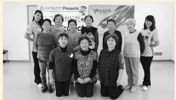
写真) 体操終了後かわいいチアリーダーと記念撮影

この日は現役バリバリの2人のチアリーダーが来町し、身体を温めるウォーミングアップや頭の柔軟性をきたえる脳トレ体操、音楽に合わせてリズムよく両手を高く挙げて「GO!」とかけ声と決めポーズをしたりと激しいチアダンス体操が行われ、元気を吸収しておったようじや。