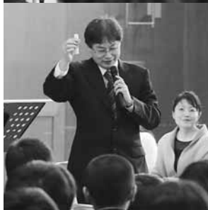
(上)二人の演奏によって体育館がコンサートホールに(下)手にするのは「ちくわ」。「ちくわ」からも美しい音色が奏でられました

昨年(2016年)から開催が計画されており、2年越しでの実現となった今回。「昨年はスケジュールが合わず実現できませんでしたでしたが、いつかはやっ