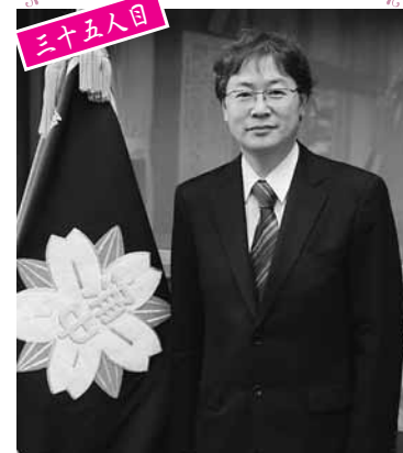
東京交響楽団首席フルート奏者 神奈川県在住