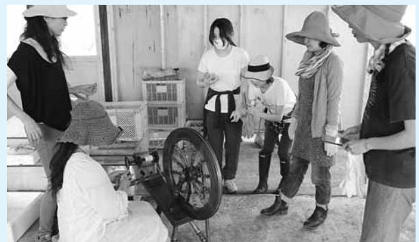
写真) 珍しい糸車を使った本格的な羊毛の糸つむぎを実演

参加された皆さんは、豊かな自然と羊たちが織りなす箕岳山黄金山牧場の景観に、大いに癒されていたようじゃ。