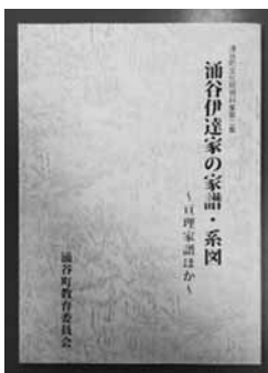
(生涯学習課 福山宗志)

涌谷町史編纂の基礎史料ともなっている『巨理家譜』。是非この機会に読んでみてはいかがでしょうか。