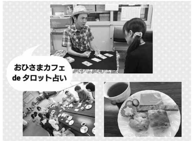
おひさまカフェ de タロット占い

待ち時間は、カフェでのお喋りや託児スタッフによる託児もあって子どもたちも楽しく過ごし、それぞれに自分の時間を楽しむことができたのではないかと思います。