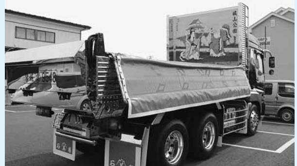
写真) 荷台部分に描かれた涌谷町のシンボル城山公園が印象的

このダンプを所有される方の涌谷町に対する並々ならぬ愛情が感じられるのう。ありがたいことじゃ。