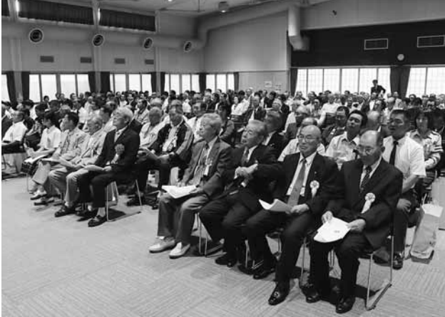
▲出席された功労者・表彰者の皆さん

▼第35回涌谷町行政区別交通事故防止コンクール（平成28年4月から平成29年3月まで涌谷町行政区別交通事故防止コンクールにおいて地域住民の連帯意識の醸成と交通安全思想の普及高揚に努力された成績）