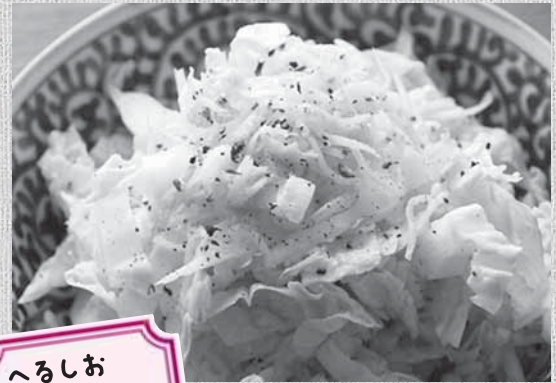
へるしおポイント

※副菜・・・ビタミン・ミネラル・食物繊維の供給源となる野菜、いも、豆類(大豆を除く)、きのこ、海藻などを主材料とする料理。また、野菜に含まれるカリウムは体内の余分な塩分(ナトリウム)を体外に出す働きがあるとされています。