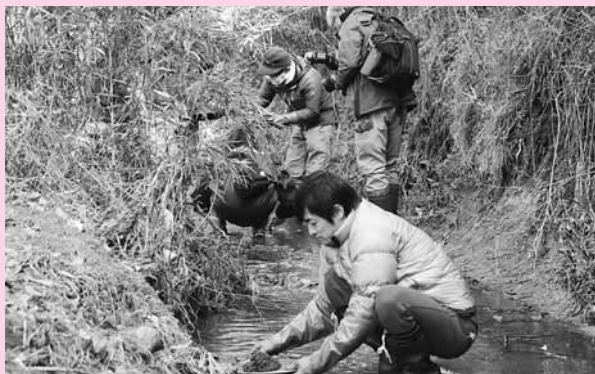
写真)大粒の砂金も採れた今回の砂金採り

その中心事業として、構成市町各地で今でも採れる「金」を集め、金メダルをつくらうという事業を行う予定じゃ。3月20日(火)に、涌谷町内で第1回目のモニターツアーを実施したのじゃが、手応えは上々!今後、採れた金を集めていき、金メダルとして使っていただけるよう、働きかけを行っていく予定となっておる。