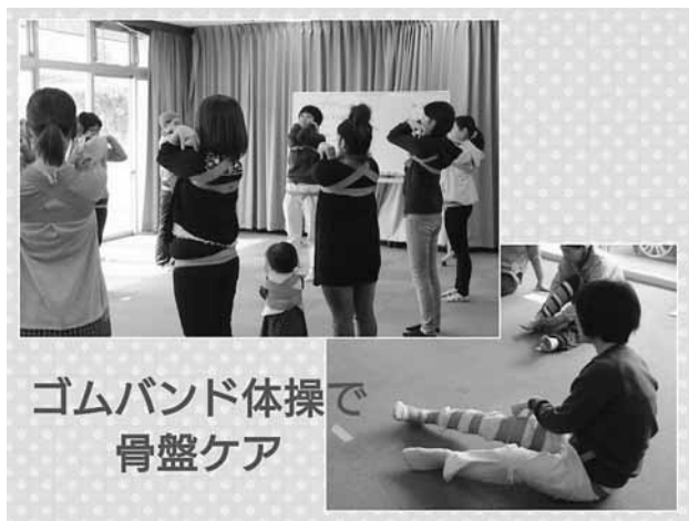
ゴムバンド体操で骨盤ケア