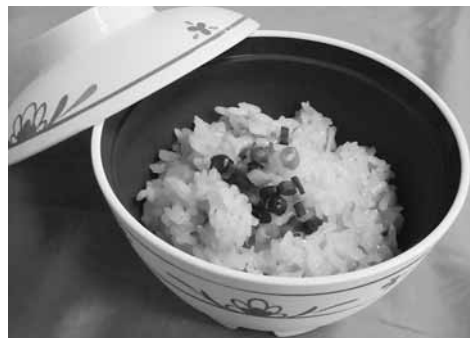
春の時期の薬膳、桜えびと生姜の炊き込みご飯