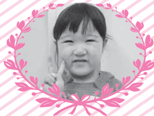
日向区 ごう 戸内 江 ちゃん