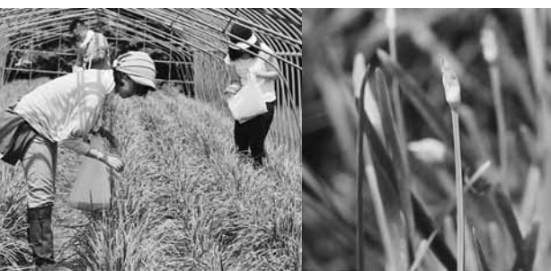
旬が短く希少な「花にら」を収穫体験。ランチやお土産で味わえます。