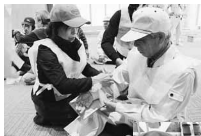
写真は、過去の防災訓練時に実施した応急救護訓練と炊き出し訓練のものです。