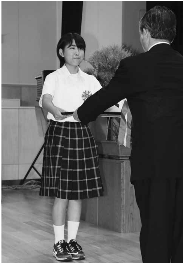
▲褒状を代表受領する浦谷中学校女子ソフトボール部さま