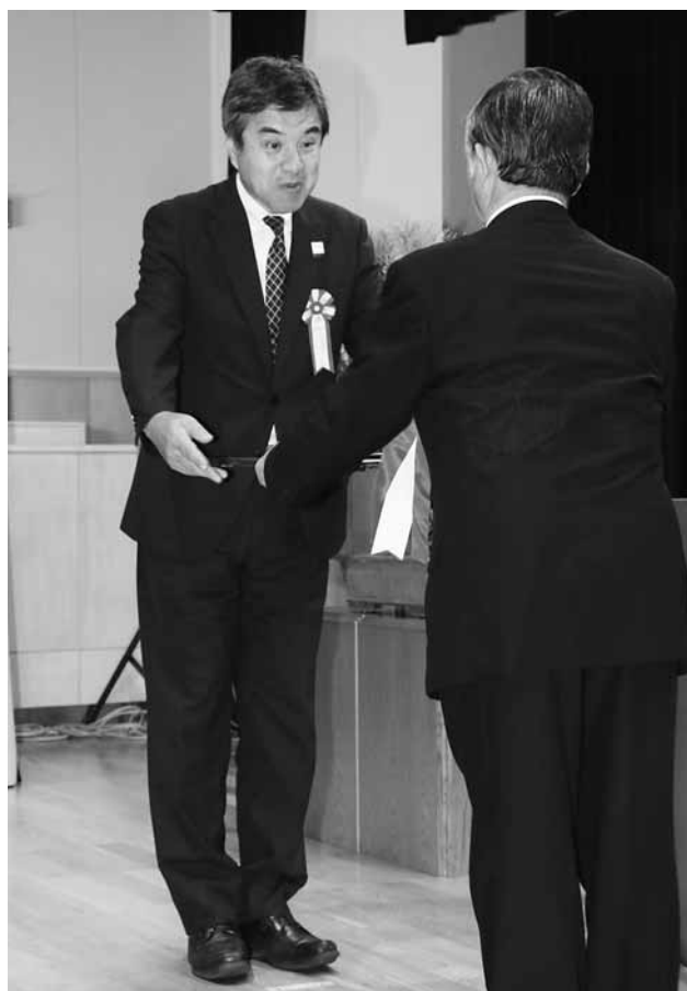
▲災害公営住宅の遊具整備費用を寄付されたNTTドコモグループさま