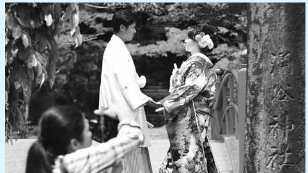
写真) 城山公園にはたくさんの撮影スポットがあるんじゃぞ

和装に着飾ったお二人の姿が、緑の葉が茂る桜並木とひさご池にかかる朱色の橋にマッチしておったぞ。城山公園で自分たちも前撮りをしたいという場合は、お気軽に涌谷町建設課都市計画班(☎43-2129)までご相談ください。