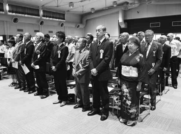
▲出席された功労者・表彰者の皆さん