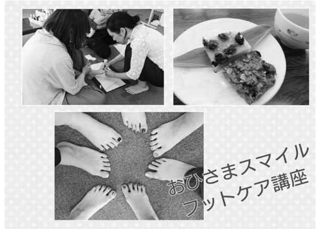
おひさまスマイル フットケア講座

やすりのかけ方や甘皮処理など一人一人丁寧にアドバイスいただきました。ティータイムのスタッフ手作りデザートは、「水無月(丹波の黒豆のせ)」と「有機シリアルのおこし」を食べました。日頃なかなか自分の時間を作れないママたちにとって素敵なりフレッシュタイムになりました。