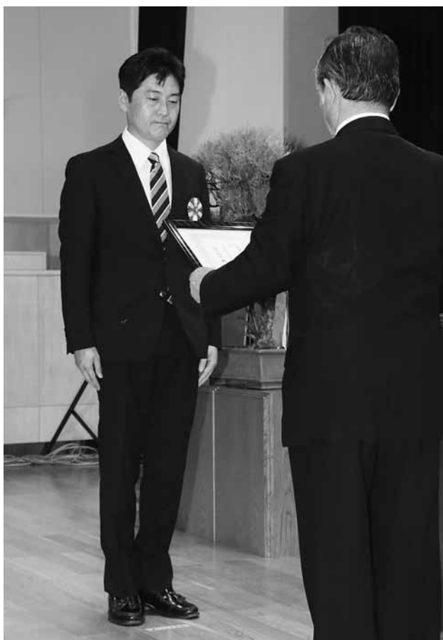
▲地域の環境美化と住民の融和に尽力されてきた長根青年会さま