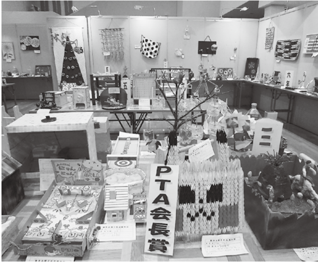
※写真は、令和元年の展示のものです。

夏休みに親子で制作した工作や図画、手芸などの作品を展示します。多くの皆さまのご来場をお待ちしています。