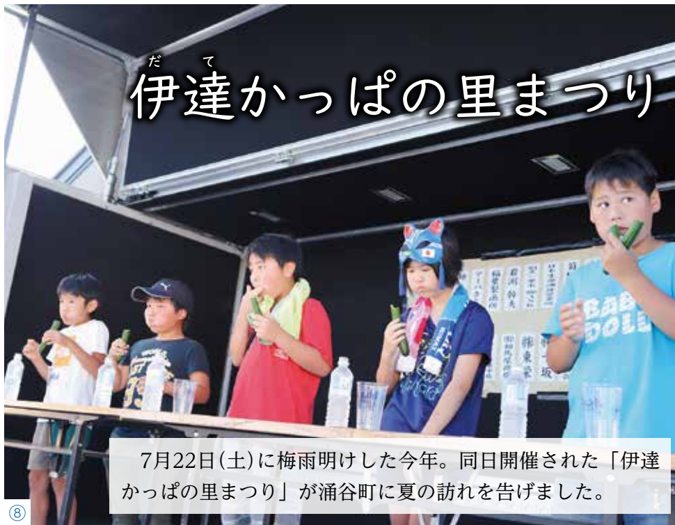
7月22日(土)に梅雨明けした今年。同日開催された「伊達かっぱの里まつり」が涌谷町に夏の訪れを告げました。