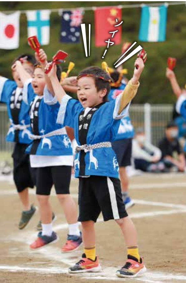
さくらんぼこども園