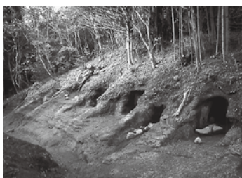
平成10年調査時の 追戸A地区3号から9号墓

現在、追戸A地区は追戸横 穴歴史公園として整備されて おり、2号墓を除いて、間近 で見学することができます。