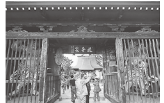
見学会で各地を巡ります