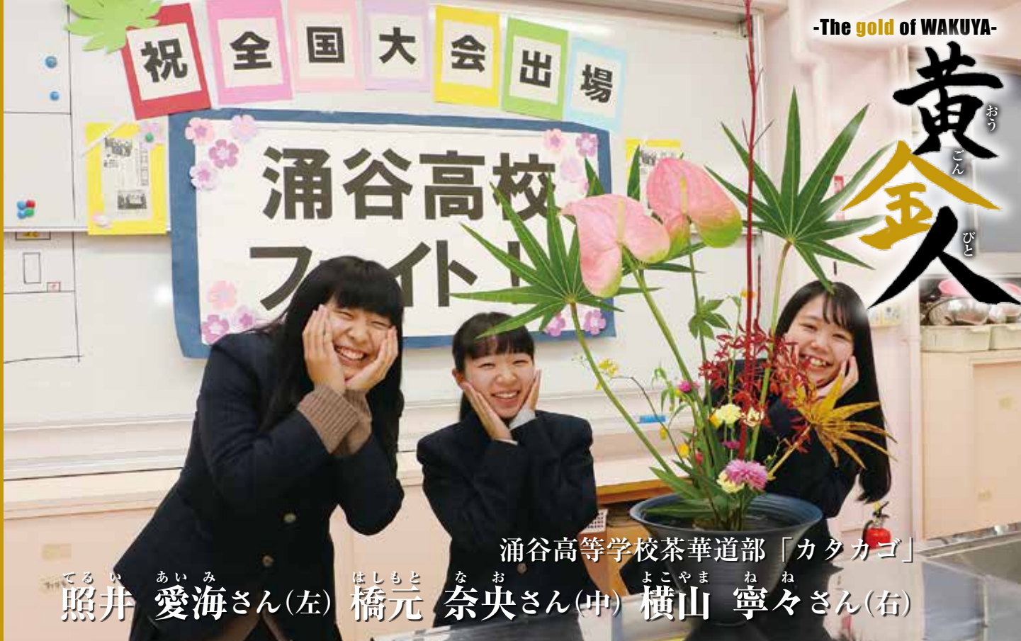
涌谷高等学校茶華道部「カタカゴ」