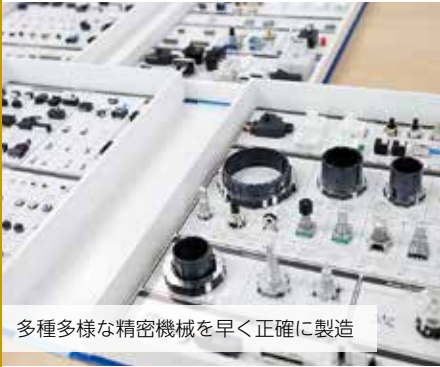
多種多様な精密機械を早く正確に製造