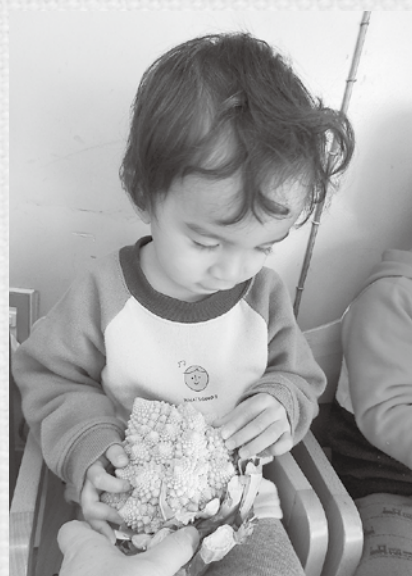
サペレメソッドでロマネスコを触っている様子