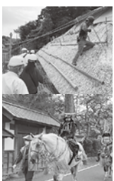
(上)旧吉田家住宅復旧現場ツアー(下)政宗まつり

日本遺産「みちのGOLD 浪漫」この旗幟の下に(六) 米しごと 黄金穂のなみ 花しごと 大崎耕土にて詠む 稔 私淑するデザイナー氏の言葉をお借りします。仕事には「米仕事」「花仕事」のふたつあり。米仕事は、日々の生活のための稼ぎ仕事。花仕事は、金銭的代価を超えた文化を伝える務め仕事。そしてこのふたつのバランスの追求こそが難しいけど大切だと。 我がまちの主要な産業稲作。生産者のみなさまの営みはすでに、米と花両者を具えていると私には思えます。今年もまた幾たびもの風水の難を乗り越え、新緑から濃緑、そして黄金へと豊穣をもたらしてくださいました。静かに畏敬の念を覚えます。 果たして、私のこの夏為した仕事は、その一端を。