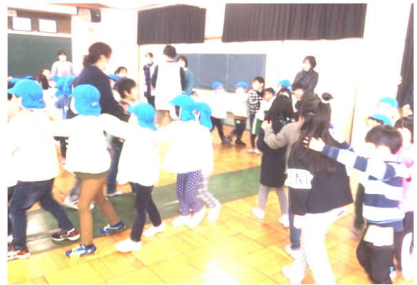
【じゃんけん列車で仲良くなりました】

当日、1年生の子供たちは、小学校の様子について教えたり、一緒に遊んであげたりと、一つ上の「先輩」として会を進める姿が見られました。どちらの子供にとっても、2か月後が楽しみな会になりました。