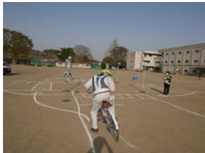
降車するときも後方確認