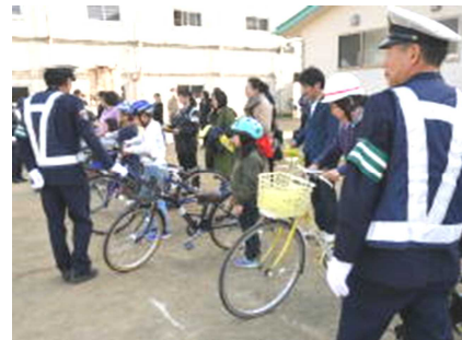
まずは自転車点検

4月23日(火)に、自転車通学のお子さん等を対象に、恒例のPTA自転車安全教室が行われました。PTA安全部が主催し、遠田警察署、涌谷町防災交通班、交通指導隊の皆様にご指導いただきました。自転車点検に始まり、後方を確認して自転車を降りるまで、たくさんのルールや技術を教えていただきました。自転車に正しく、安全に乗ることの大切さを知り、実際に走行するところで実践に結び付く講習会でした。今回学んだことをしっかり生かして安全に走行してほしいと思います。