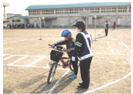
交差点では一時停止