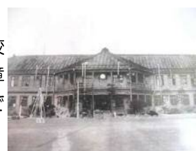
涌谷高等尋常小学校

7月1日(月)は、本校の開校記念日です。明治6年の開校以来、今年で147年目を迎えます。本日の児童朝会では、計画委員が学校に関するクイズを出しました。創立からの年数や校歌の作曲者、校章に関するクイズが出題されました。学校の歴史について知ることができ、愛校心が芽生えたようです。長い歴史とよい伝統とを受けついで、これからも学校の歴史の1ページを創っていきたいと思います。