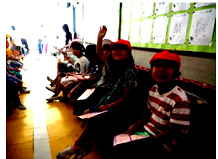
人気のお店には行列が