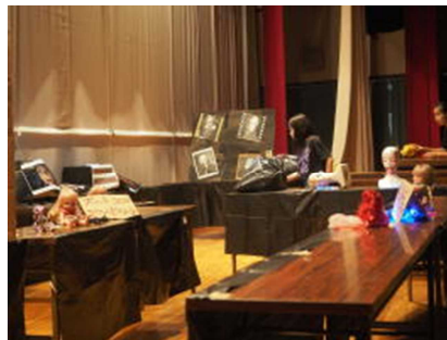
こわーい お化け屋敷