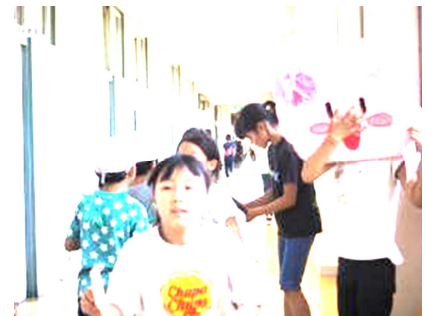
マスコットを作って宣伝