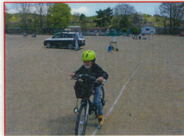
(春の交通安全教室)