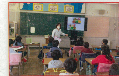
(給食前の栄養教諭の講話)

涌谷町特産の「小ネギ」を使用した給食を提供したときに、栄養教諭から「小ネギ」の生産や栄養について説明するなど、「地場産品」「地産地消」について学ぶ機会を設定しています。