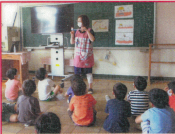
(歯磨きブラッシング指導)

「遠田警察署」「交通指導隊」「涌谷自動車学校」「歯科衛生士」「涌一子どもっこクラブ」等、外部の方から様々な場面で指導をいただいたり児童の活動を支援していただいたりしています。