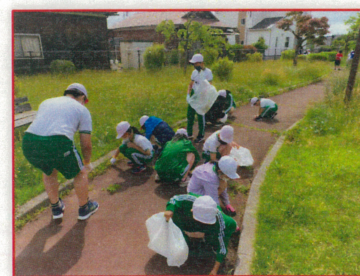
(春の地域清掃活動・涌谷駅)