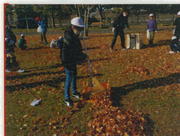
(秋の地域清掃活動)