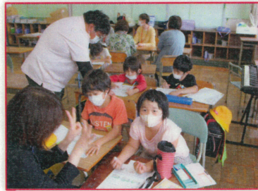
(涌一子どもっこクラブ)