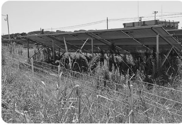
農地転用申請のあった土地がその後目的通り転用されているか確認しています

令和元年8月27日から9月26日にかけて、町内全域の農地について、適切に利用されているか調査いたしました。今後は調査結果を踏まえて、遊休農地の解消や違反転用の防止に取り組んでいきます。