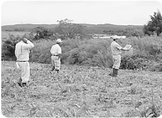
農地パトロールの様子