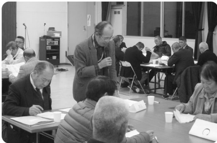
活発な意見交換が行われました

1月23日、農業委員、農地利用最適化推進委員、認定農業者による意見交換会が、役場大会議室で開催されました。農業委員・農地利用最適化推進員14名、認定農業者16名が4班に分かれ「地区の課題について」をテーマに意見を交わしました。各班それぞれ活発な意見が出され、予定時間を超えて意見交換が行われました。 取組作物、面積、経営上困っていることは農家ごとにそれぞれ違うため、様々な意見が出されました。出された意見には、 ・農地の維持管理における労働力不足