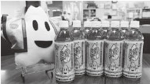
今年は製造されないはと麦茶