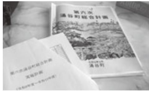
第六次涌谷町総合計画

ほか、「婚活事業の充実」に取り組み。住宅の整備についても、検討事項の一つと考えているが、働き口の確保、空き家の活用などと併せて、移住定住の獲得の対策をしていく。