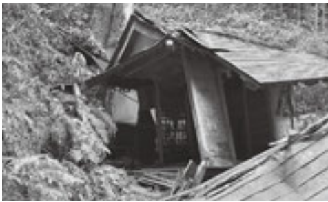
地元ではお不動様と言われる