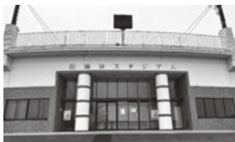
涌谷スタジアム入口