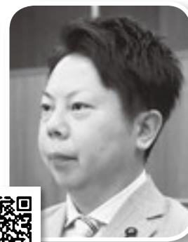
いちじょうゆうたろう 一條裕太郎 議員