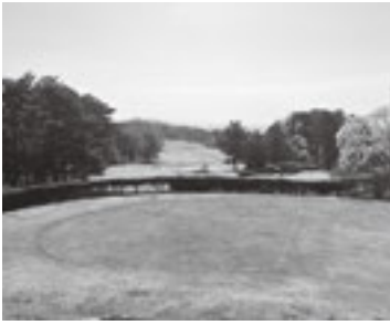
涌谷カントリークラブ

問 ゴルフ場の土地賃付料において、契約で金額が決まっているのか、協議して決めているのか。評価額に合った額を請求すべきだ。