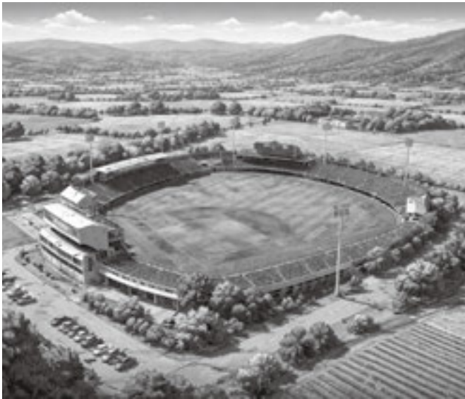
AIによる球場のイメージ図

問 楽天の2軍誘致を進め、未来の子どもたちに夢を与える活性化策として考えるべきではないか。