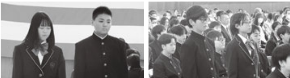
入学式の入場と点呼

中学校の入学式を取材しました。小学校の入学式の様子と違い、やはりしっかりと生徒の皆さんでした。