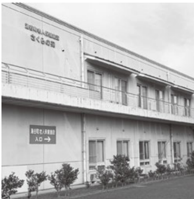
令和9年4月に特別養護老人ホームへ

持続可能な体制を構築するため、来年度から、老人保健施設から特別養護老人ホームへ転換を想定している。社会福祉協議会へ指定管理委託を予定する。