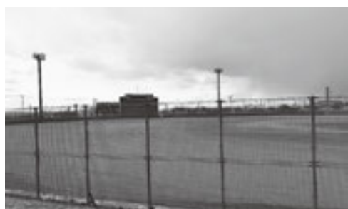
涌谷スタジアムグラウンド

涌谷スタジアムは、野球関係者からも高評価であり、地形的魅力がある。その魅力をもう一度見直して、その時に備えて、しっかりと議論をできるように準備しておく必要があると考える。引き続き情報収集を進めていく。