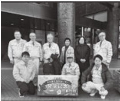
女川原子力PRセンター前