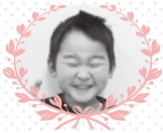
猪岡区 渋谷 律 くん