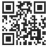
国税庁 ホームページ