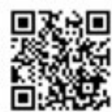
デジタル庁 参考動画