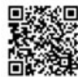
デジタル庁 ホームページ

法令改正により従来の保険証の新規発行がなくなり、マイナンバーカードの保険証利用に移行しています。まだ利用登録をしていない人は、ご検討ください。 マイナ保険証を利用すると、医療情報を活用したより良い診療が受けられ、健康管理も