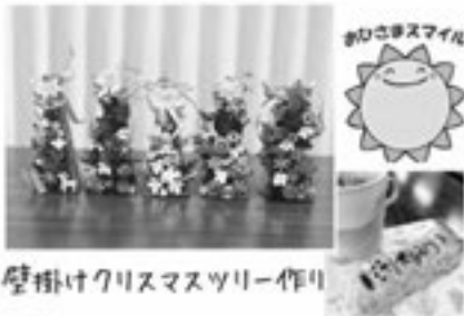
壁かけクリスマスツリー作り

12月12日(金)に涌谷町町民医療福祉センター集団検診室で、「壁かけクリスマスツリー作り」を開催しました。ドライフラワーや木の实など、ナチュラルな花材の中から好みのパーツを選び、色合いや配置を考えながら制作しました。参加した皆さんは、それぞれの個性を生かしながら夢中になって取り組み、壁かけでも卓上でも楽しめる、温かみのある素敵なクリスマスオブジェが完成しました。