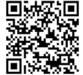
涌谷町訪問看護ステーション