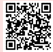
チャット相談 あなたのいばしょ

▼任用期間 令和8年4月1日～令和9年3月31日(年末年始12月29日～1月3日)と休館日を除く