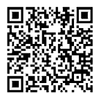
申し込み フォーム