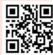
LINE相談 生きづらびっと