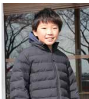
涌谷幼稚園 卒園生

閉園前最後の1年となった今年度は、3歳児の入園が1人ととどまりましたが、それでも新入園児を迎えられたことで雰囲気明るくなり、全園児12人と職員たちで楽しい時間を過ごすことができました。長年にわたり涌谷南幼稚園で勤務させていただき、担任をしていた頃の子どもが保護者になって再会できた時の嬉しさは、仕事冥利に尽きるものだと感じています。4月からの新しい環境では戸惑うこともあるかと思いますが、涌谷南幼稚園での思い出を忘れず元気いっぱい楽しんでください。