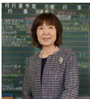
涌谷南幼稚園 園長

町立幼稚園最後の年に子どもたちと過ごした先生や、卒園生、保護者の皆さんに、閉園の寂しさや来年度への思いについてインタビューしました。