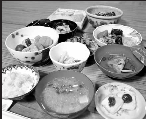
中之坊でふるまわれた奥深い味わいのお精進