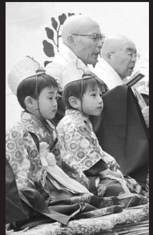
緊張の面持ちの御稚児さん