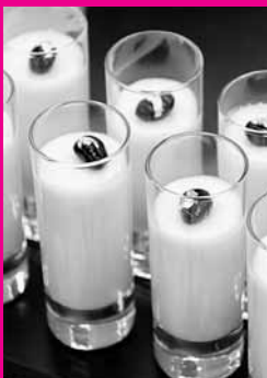
金箔をあしらった涌谷産豆腐のスイーツ