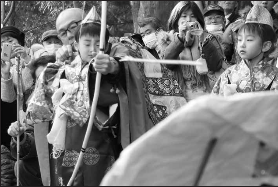
多くの方が弓の射る先を見つめる

その歴史は古く、600余年にわたり簗岳の地に継承され、現在は、宮城県の重要無形文化財にも指定されています。