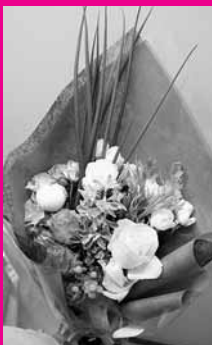
小ねぎと水菜が入ったベジフラワー