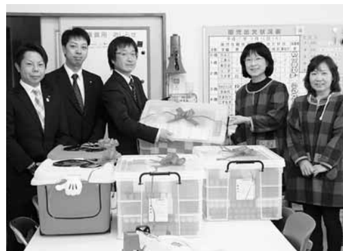
写真左) 玩具を手渡す遠田商工会青年部の皆さん

3月16日(月)に、遠田商工会青年部からさくらんぼこども園に、ブロックの玩具5セットが地域社会貢献活動の一環として寄贈されました。