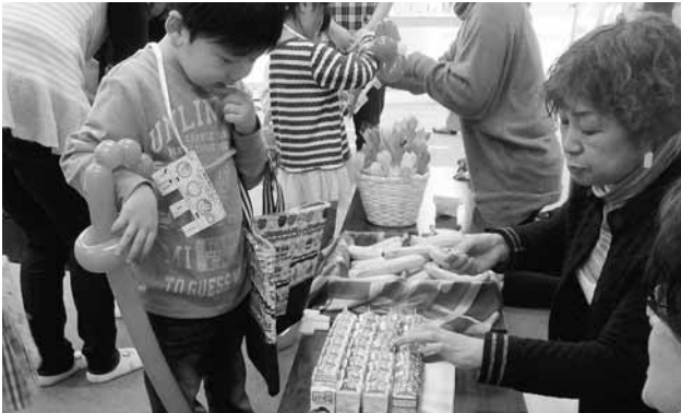
写真)パン屋さん、ジュース屋さん、バナナ屋さんなどのお店コーナー

3月25日(水)、町民医療福祉センターで、恒例になった「わくわくパラダイス」を開催しました。春休み中の子ども達30名と保護者の皆さん総勢55名が大集合！チケットと交換するお買いものごっこに、アートバルーン風の風船屋さんが初出店。射的、輪投げ、魚釣りのゲームコーナー。くるくる回るタコ足風車の工作コーナー。盛り沢山なわくわくに子ども達は大喜び。更にわくわくタイムは続いて、ピアノのBGM付きの紙芝居や、オカリナ演奏に合わせたパネルシアター、歌ったり、踊ったりもしてあっといふ間のひと時。場内いっぱいには笑顔と歓声が響いて大盛況でした。