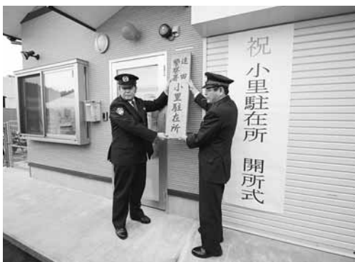
写真) 開所式にて新たな駐在所の看板を設置

4月20日(月)に、遠田警察署小里駐在所が、新築移転し開所式が執り行われました。明治21年に笹岳駐在所としての開所以来、移転や分所、改名を経て、長きにわたり小里地区の治安を守り続け、今後も装いも新たに守り続けてくれることでしょう。