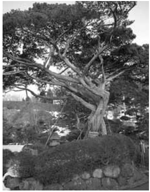
（右）神主が持つ「笏」 （左）樹高約7.87m、幹周り約1.1m