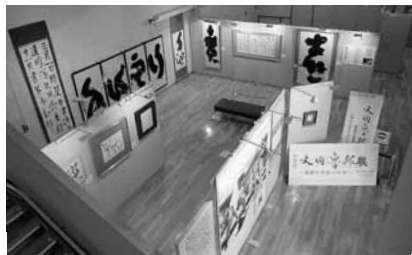
平成24年の展示風景

涌谷町出身の書道家、前衛書道家として名を馳せ、その独自の世界を確立し、素晴らしい作品を残された故・大内魯邦氏の作品を展示します。