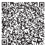
涌谷野桜花と麓岳ひな《涌谷町非公認萌えキャラ》 5月8日 21:08 涌谷って歴史のある町なのよね〜。 普段の生活にはこれといって影響はないんだけど。。

頭に城山を載せた「涌谷野桜花」とつるしびなを頭に付けた「麓岳ひな」。ご覧になりました方は、下記から。