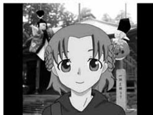
涌谷野桜花と麓岳ひな《涌谷町非公認萌えキャラ》 5月8日 21:30 のっぴー！ 麓岳ひな《のっぴー》です。 桜花ちゃんに誘われて、ぼくも動画アップしました〜。 みんな見てほしいな〜。…もっと見る

頭に城山を載せた「涌谷野桜花」とつるしびなを頭に付けた「麓岳ひな」。ご覧になりました方は、下記から。