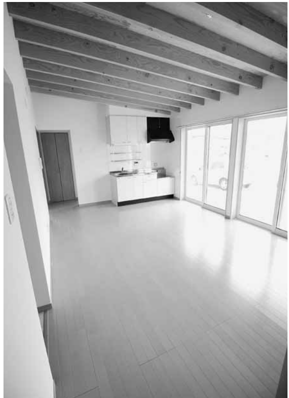
災害公営住宅は、やさしい木のぬくもりあふれる住宅

▶ 入居要件 同居親族の有無、収入等に係わらず、次のすべてに該当すること。①住宅の罹災程度が全壊の世帯 ②住宅の罹災程度が半壊・大規模半壊で解体した、又は解体することが確実である世帯 ③現在、住宅に困っていることが明らかなこと ④町税等を完納している方 ⑤暴力団員による不当な行為の防止等に関する法律（平成3年法律第77号）に規定する暴力団員でないこと