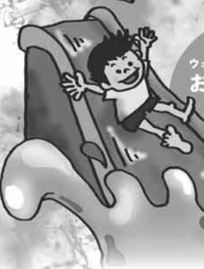
大型プール ドリームボート ウォーターズライダーで おもいきり あそぼう!!