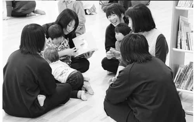
(上) 避難経路と避難行動要支援者を地図上で確認 (下) 子育てサークルで自らも楽しみながら絵本を読み聞かせる