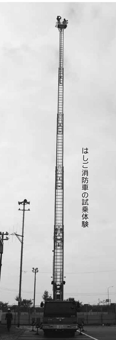
はしご消防車の試乗体験