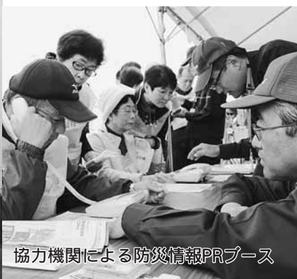
協力機関による防災情報PRブース