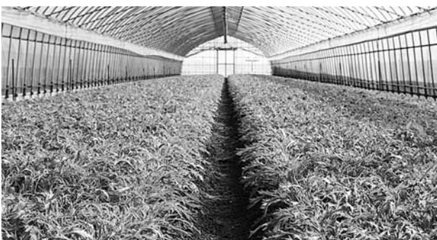
農業を中心とした地域経済の再興へ