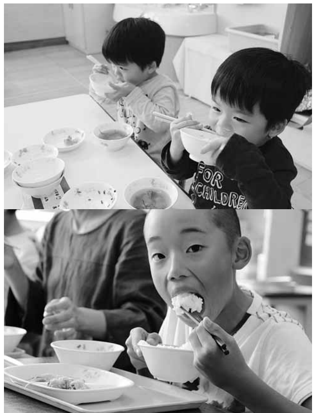
(上)キラキラの笑顔でつやつやの新米をほおぼる (下)ごはんバットが空っぽになった教室も多いはず