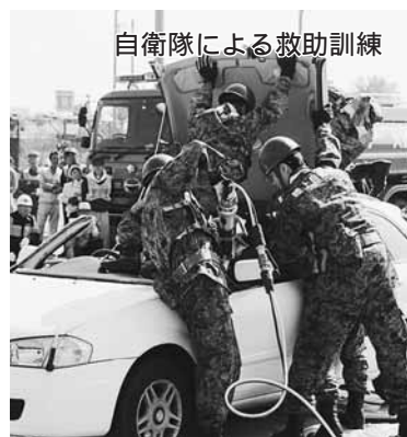
自衛隊による救助訓練