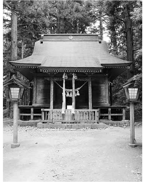
不変の輝きをたたえる産金の歴史

特に、雇用の確保においては、ものづくり中小企業・小規模事業者試作開発等支援事業を活用するなど支援策を強化し、涌谷町内で操業している既存企業の操業環境のインフラ整備、従業員の働く意