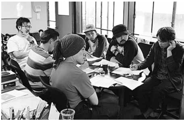
若者の力をまちづくりのステージへ

現在、国が、最も力を入れていく「まち・ひと・しごと創生総合戦略」を最大限活用できる計画の策定とそれに専門に対応できる組織体制を作りたいと考えております。