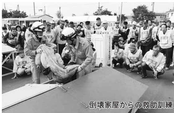
倒壊家屋からの救助訓練