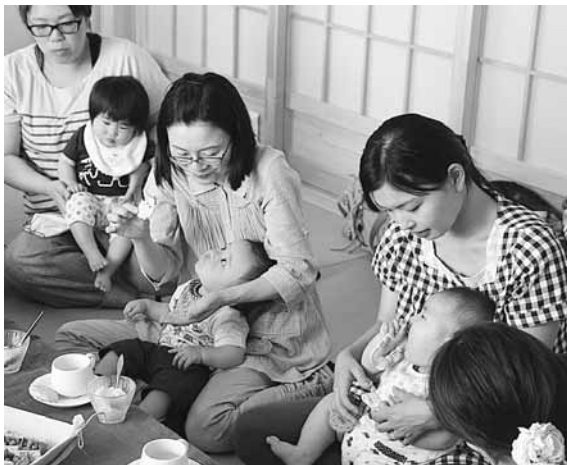
安心して子育てができる環境づくりを

当町においてはピーク時には2万4千人余あった人口が、現在では1万7千人を割ろうとしている状況であります。