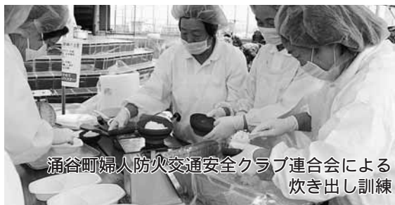
涌谷町婦人防火交通安全クラブ連合会による炊き出し訓練