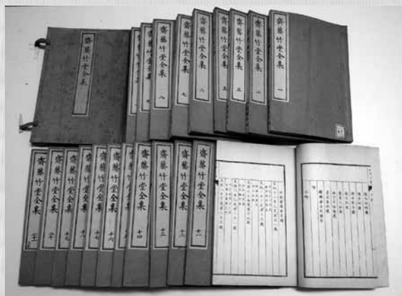
▲齋藤竹堂全集（全21巻）

このような記念展を開催された地元の方々熱意に敬意を表すとともに、今回の記念展を一つの契機として、竹堂の精神が一層広く理解され、次なる百年へと継承されていくことを期待しています。