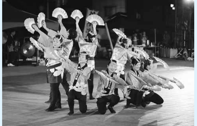
写真) 上：江合川の流れる涌谷の情景を表現した清流江合太鼓、下：桜色の扇を持ちヒラヒラと優雅にすずめのように舞う