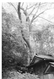
【天然記念物】 不動沢のけやき