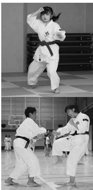
中学校では吹奏楽部と美術部に所属する2人。演舞が始まると目に気迫が宿り、大人も圧倒されるキレのある演武を繰り出します。

楽天イーグルス観戦優待企画 ▼日程 9月10日(土)、11日(日) 北海道日ハム戦 ▼価格 1千円 ▼席種 球団指定の席 ▼申込方法 役場町民室に設置してあるチラシのQRコードからお申し込みください。 ▼申込締切 対象試合日2日前の18時まで ▼注意事項 お申し込み状況により締切前に受付を終了する場合があります。詳細はお問い合わせください。 ▼問い合わせ先 楽天野球団チケットセンター ☎050-5817-8192 (10時～18時不定休)