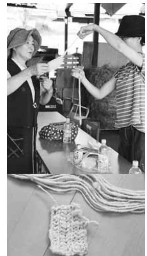
(上)羊毛から手仕事で毛糸をつむぎます (下)サフォーク特有の仕上がりに