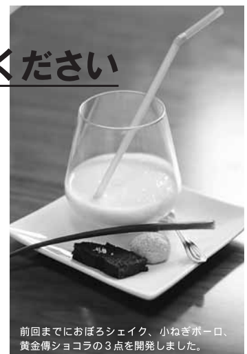
前回までにおぼるシェイク、小ねぎボーロ、黄金傳ショコラの3点を開発しました。