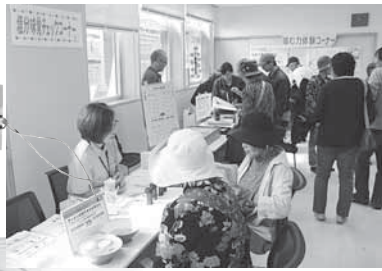
高血圧予防に 塩分味覚チェック