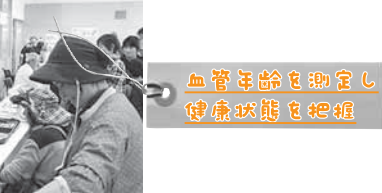
血管年齢を測定し 健康状態を把握