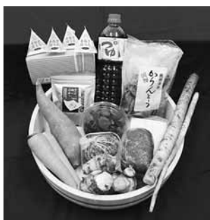
▲写真は城山パック

▼ 申し込み・問い合わせ先 涌谷町観光物産協会事務局（まちづくり推進課内）☎43-2119