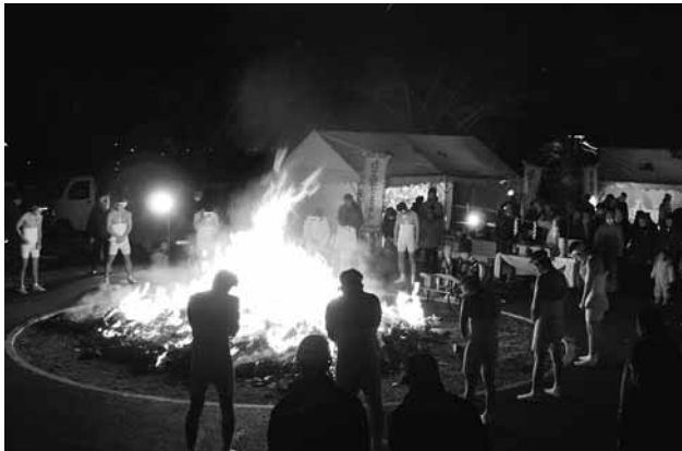
写真) 御神火を囲むさらし姿の若者たち

1月14日(土)に、例年開催されている「どんと祭」が、今年も開催されました。今年、遠田商工会青年部涌谷地区の有志の発案によって、20数年ぶり「裸参り」を復活させました。厳寒の夕暮れ時、鉢巻きに、さらし、半股引、足袋をまとった16人の若者がさっそうと登場しました。駅前通りを直進し、涌谷大橋を渡り、城山公園内を抜け、涌谷神社へ約30分かけて裸参りを行いました。今回の裸参りをよみがえった伝統として来年以降も継続していくそうです。