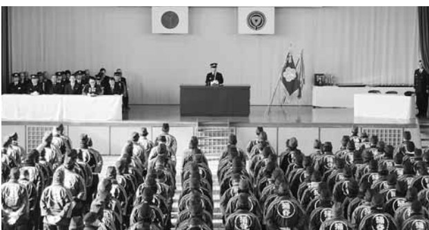
▲涌谷町の消防団員が一堂に会す壮観