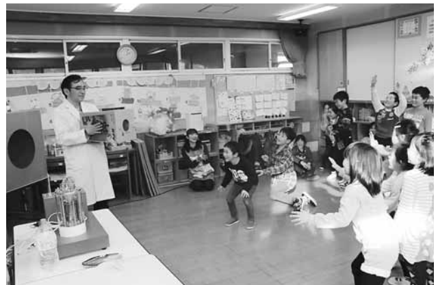
写真) 空気砲から吹き出される煙の輪に楽しそうに飛びつく子どもたち

12月27日(火)に、涌谷町内の4つの学童クラブにおいて、東北電力株式会社の社会貢献活動の一環「放課後ひろば」が開催されました。 「放課後ひろば」は、次世代を担う子どもたちの個性や才能を、地域と共にのびのび育てることを目的したもので、この日は、「電気を作る仕組み」と「電気をさまざまな力に変える」ことについて、体験型の科学実験が行われました。 「科学や実験にふれられて楽しかったので、また来てほしい」という感想も出て、充実した学習の機会となりました。