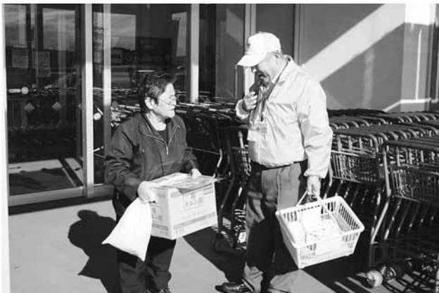
写真) 人権擁護委員が買い物される人、一人ひとりに案内

12月10日の人権デーを最終日とする1週間を人権週間と定めています。当町では、12月6日に人権尊重思想の普及高揚のため、人権擁護委員が街頭キャンペーンを行いました。また、同日役場において、特設人権相談所も開設しました。 なお、毎月開設している人権相談では、身近な家庭内の悩みごとや学校でのいじめ、職場でのパワハラなど、人権問題でお困りの方の問題解決に向けて、人権擁護委員が相談をお受けします。相談は無料で、秘密は厳守します。相談日などは広報わくやで確認してください。