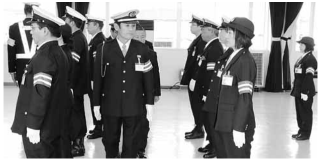
▲服装点検で身も心も引き締め新たな年の幕開けに臨む