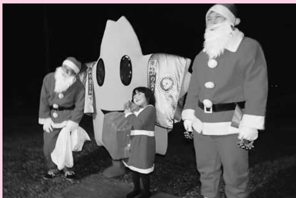
写真) プレゼントを受け取り、キラキラと目を輝かせる子どもと記念に

12月24日(土)のクリスマススマイルに、八雲児童館の父親クラブの皆さんと共に、今年も涌谷町内のご家庭を回らせていただき、良い子にしておった子どもたちにプレゼントを届けてまいりました。 家の外におるわたしたちの気配が感じると、家の中から慌てて動き出す物音と「きた〜」という驚きと喜びの入り混じった声が聞こえてまいる。 一年に一度のクリスマスを楽しみ待つ子どもたちのもとへ、プレゼントと共に、感動を届けられるというのは、わしにとってもうれしかぎりじゃ。