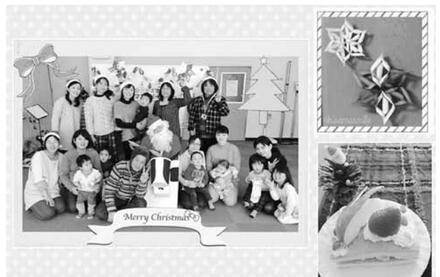
写真) 笑顔いっぱいのコンサートを開催できたことに感謝申し上げます

12月21日(水)町民医療福祉センター集団検診室で『クリスマスパーティー』を開催。クリスマス飾りにピッタリの『スノーフレーク』を作りました。 デザートタイムには、スポンジケーキに各自フルーツやクリームをデコレーション。個性あふれるケーキができました。 毎年恒例のクリスマス演奏会は、スタッフによるハンドベル演奏とオカリナ彩音のメンバーさんによるオカリナ演奏。そして、演奏の終盤：やってみましたサンタさん。 ゆかいで優しいサンタさんに会って、楽しい気分になれる素敵なパーティーになりました。