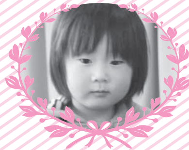
大谷地区 白幡 青空 くん そら