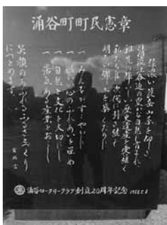
涌谷町役場入口の石碑の町民憲章

この「町民憲章」は、人々も町自体も健康で創造的であり、まだ活気にあふれたなつかしい時代のふんいきを私たちに感じさせてくれます。