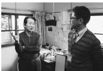
(右)三塚漆器店で「浦谷竜文塗」の情報収集。地域資源を磨き上げ、新たな商品開発へ

仙台市から移住し着任。4月1日から2人目の地域おこし協力隊員として『観光』の分野を中心にまちおこしに取り組みます。東日本大震災後は、女川の復興支援にも携わってきました。