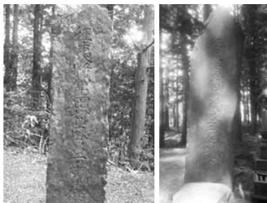
写真は征夷將軍田村麻呂一千年供養碑 右：笠峯寺 左：零羊崎神社(元長禪寺)

供養塔はどちらも稲井石で形も大きさもよく似ています。一緒に作られてそれぞれ運搬、建立されたと考えられます。江戸時代、共に伊達藩の祈願寺であり、また奥州三観音に名を連ねる笠峯寺と長禪寺です。この時期、両寺の間には緊密な往来があったのではないのでしょうか。